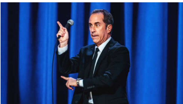
เจอโรม ไชน์เฟลด์ (Jerome A. Seinfeld)

รายงานฉบับนี้จัดทำขึ้นโดยข้อมูลเท่าที่ปรากฏและเชื่อว่าเป็นที่น่าเชื่อถือได้แต่ไม่ถือเป็นภาระยืนยันความถูกต้องและความสมบูรณ์ของข้อมูลนี้ๆ โดยบริษัทหลักทรัพย์ ยูเอสบี เคย์ เฮียม (ประเทศไทย) จำกัด (มหาชน), ผู้จัดทำขอสงวนสิทธิ์ในการเปลี่ยนแปลงความเห็นหรือประมาณการณต่างๆที่ปรากฏในรายงานฉบับนี้ โดยไม่ต้องแจ้งล่วงหน้า รายงานฉบับนี้มีวัตถุประสงค์เพื่อใช้ประกอบการตัดสินใจของนักลงทุน โดยไม่ได้เป็นการชี้แนะหรือคำแนะนำในการซื้อขายหลักทรัพย์ หรือตราสารทางการเงินใดๆ ที่ปรากฏในรายงาน